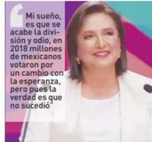
Jorge Álvarez Máynez MOVIMIENTO CIUDADANO.

Mi sueño, es que se acabe la división y odio, en 2018 millones de mexicanos votaron por un cambio con la esperanza, pero pues la verdad es que no sucedió