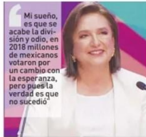
Jorge Álvarez Máynez MOVIMIENTO CIUDADANO.

Mi sueño, es que se acabe la división y odio, en 2018 millones de mexicanos votaron por un cambio con la esperanza, pero pues la verdad es que no sucedió