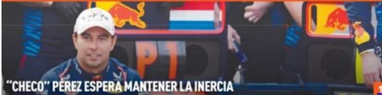
“CHECO” PÉREZ ESPERA MANTENER LA INERCIA